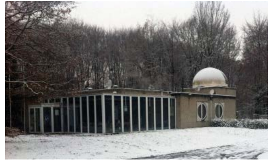
Het gebouw in 2012

En daarmee zou Heerlen's en Limburg's enige sterrenwacht met haar unieke educatieve aanbod en haar cultureel erfgoed, ophouden te bestaan.