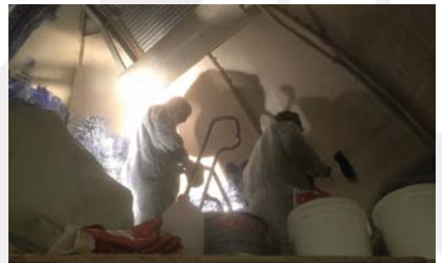
In 2012 werd vooral veel tijd besteed aan reparaties en restauraties. Ook de grote telescoop werd flink onder handen genomen.

Dit resulteerde uiteindelijk dat op 22 februari 2013 sterrenwacht Limburg formeel haar deuren opende. Sindsdien mogen we met trots terugkijken op een succesvol traject met toenemende bezoekers, activiteiten en het blijvend behoud van het sterrenkundige cultureel erfgoed waar onze sterrenwacht - en daarmee Limburg - zo rijk aan is. In de loop van de tijd ging de sterrenwacht ook samenwerken met verschillende partijen uit de regio om het draagvlak voor educatie op het gebied van sterrenkunde en natuurkunde te blijven versterken. Dit alles hadden wij natuurlijk nooit kunnen realiseren zonder de blijvende ondersteuning van onze vrijwilligers, donateurs, stakeholders en subsidiënten. Mede dankzij hen blijft Heerlen en Limburg rijk aan het unieke sterrenwacht concept.