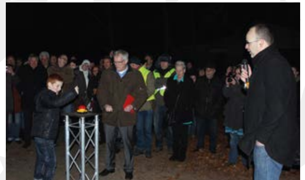
Op 22 februari 2013 vond de formele opening plaats. Wethouder van Zutphen en zijn zoon openen Sterrenwacht Limburg.